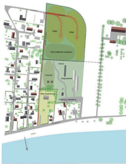
De første skitser til et nyt boligområde bag energiakademiet.

Der er udarbejdet et lokalplanforslag som åbner for anden anvendelse af bofællesskabet i Onsbjerg. Bofællesskabet er flyttet til hus fem på Kildemosen og der er ikke længere efterspørgsel efter lokalerne som bofællesskab for handicappede. Den nye lokalplan vil gøre anden anvendelse mulig, men bekræfter at bygningen og grunden fortsat må bruges som bofællesskab for handicappede. Lokalplanforslaget er ikke i strid med kommuneplanrammen og forvaltning foreslår en offentlig høring af 14 dages varighed. Der er syv boenheder i ejendom-